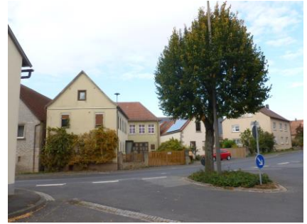
Ochsenfurter Straße 5a