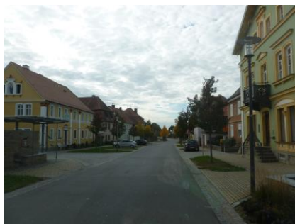
Sanierte Anwesen entlang der Hauptstraße