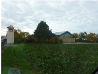
Deutschherrenhalle (Bürgerverein, Sport, Musik, Jugend) und Schützenhaus