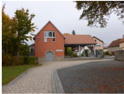
Gemeindehaus mit Dorfplatz