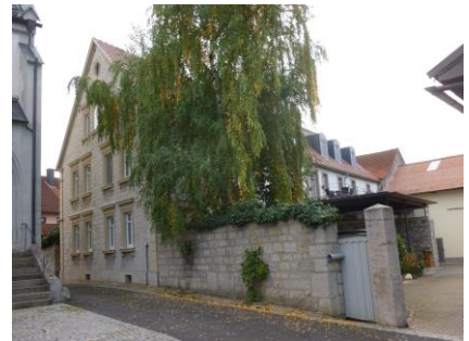
Vorbildlich saniertes Anwesen Kirchplatz 2