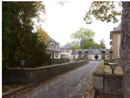
Ehemaliges Schloss, heute Naturheilkundeklinik