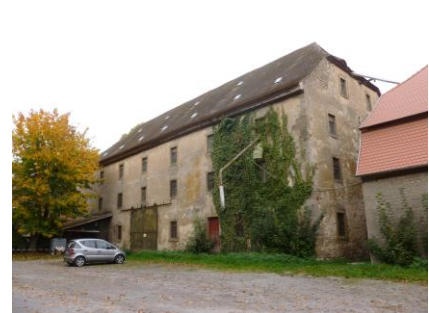
Ehem. Ökonomiegebäude des Gutshofes (dreigeschossiger Massivbau mit Halbwalmdach wohl um 1800, mit älterem Kern