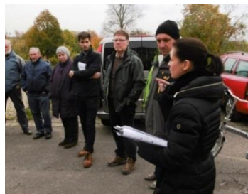
Ortsrundgang Eßfeld

Bereits im Jahr 2015 begonnen, konnte die allianzweite Innenentwicklungsstrategie in diesem Jahr nahezu fertiggestellt werden. Durch eine Vielzahl an Ortsbesichtigungen, Innenentwicklungswerkstätten mit den kommunalen Vertretern und Informationsveranstaltungen wurden neben der Sensibilisierung der Bürgerinnen und Bürger auch eine Fülle an Maßnahmevorschlägen entwickelt, die die Allianzkommunen nun gezielt zur Bekämpfung von Leerständen und zur Stärkung der Altorte angehen können.