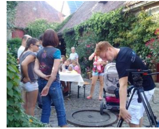
Videodreh Stalldorf; Foto: EA-Emotional

Zusammen mit der Agentur EA-Emotional aus Eibelstadt verwirklichte die Allianz den Dreh zum Informationsfilm „Leben im Dorfkern“ . Mit der großartigen Unterstützung durch die Theatergruppe Riedenheim konnte dieser im August 2016 gedreht werden. Als Drehort diente das alte Pfarrhaus im Riedenheimer Ortsteil Stalldorf. Anfang 2017 wird das Video dann offiziell vorgestellt werden können.