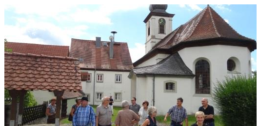
Kulturwegerundgang, Foto: Allianz Fränkischer Süden

Auch im Projekt „ Kulturwegenetz im Fränkischen Süden “, welches die Allianz gemeinsam mit dem „Archäologischen Spessartprojekt e.V.“ umsetzt ging es in 2016 mit großen Schritten voran. So traf sich alleine der Arbeitskreis „Kulturwege für Giebelstadt“ vier Mal und besichtigte weiterhin in zwei Begehungen die herausgestellten „verborgenen Schätze“ der Ortsteile Ingolstadt, Sulzdorf und Giebelstadt. Auch der Eröffnungstermin steht schon fest: 01. Oktober 2017!