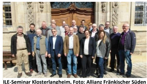
ILE-Seminar Klosterlangheim

Zudem besonders wichtig war das ILE-Strategieseminar in der Schule für Dorf- und Flurentwicklung Klosterlangheim, bei welchem zum einen der bisherige Umsetzungsprozess evaluiert, aber auch die nächsten Schwerpunkte und Projekte erarbeitet wurden. Das Ergebnis sind 17 Maßnahmen und Projekte aus den unterschiedlichen Themenfeldern, welche die Allianz gemeinsam in den nächsten zwei Jahren umsetzen will.